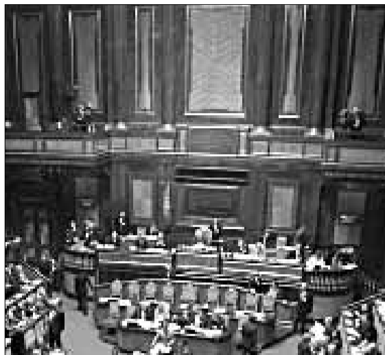
Il Parlamento italiano

Per i cattolici si è trattato di una conquista faticata perché essi avevano appoggiato, subito dopo Porta Pia, la Chiesa nella sua polemica contro il giovane Stato unitario, e debbono a Luigi Sturzo (un prete) e a Maritain (filosofo francese) la loro concezione dello "stato di diritto" e della sua autonomia dal potere religioso. Ciò per dire che esiste una laicità che unisce cattolici laici e laici non cattolici, cementata dalla comune